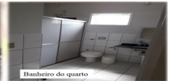
Banheiro do quarto