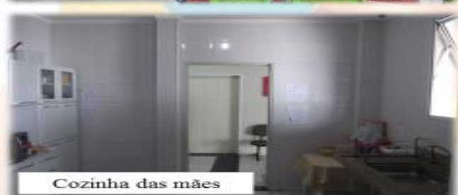
Cozinha das mães