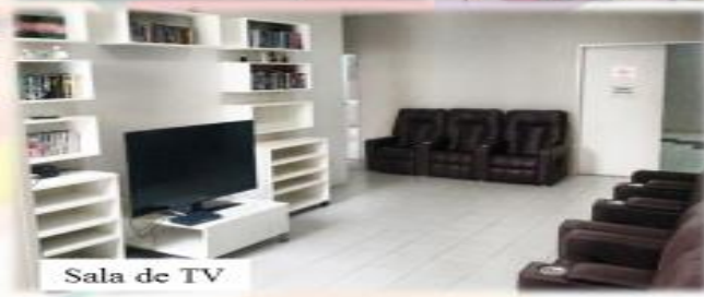
Sala de TV