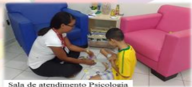
Sala de atendimento Psicologia