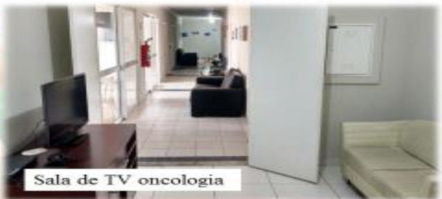
Sala de TV oncologia