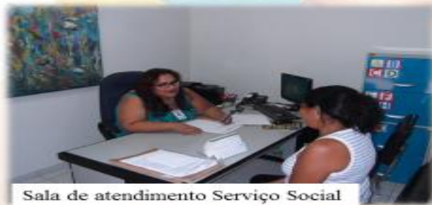
Sala de atendimento Serviço Social