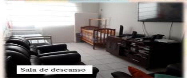
Sala de descanso